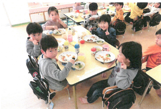
おひなさまランチの写真です