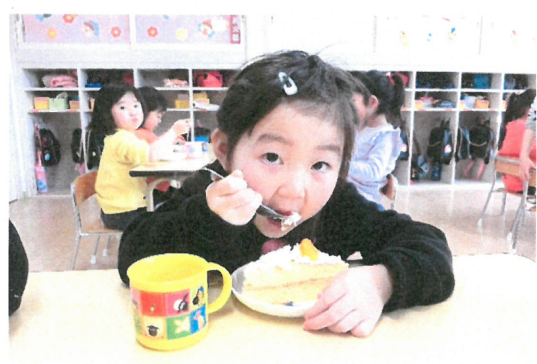
おいしそうに食べていますね