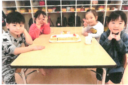
ひなまつりケーキと一緒に各グループで写真を撮りました!!