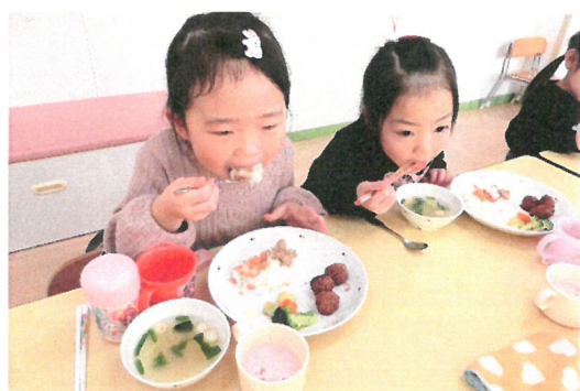
ぜんぜんぶたにべたよ