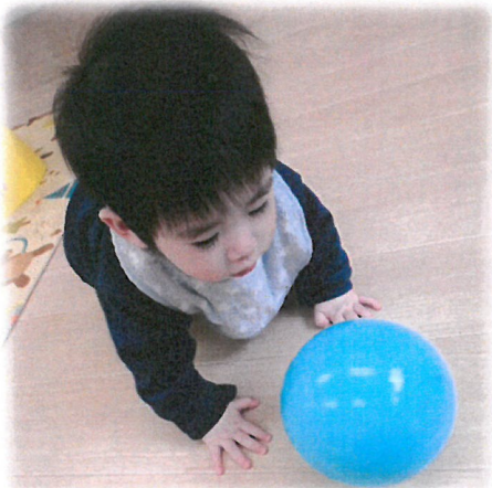
みんなが ボール遊び中!! 転がして追いかけて