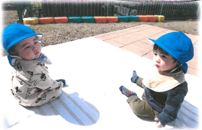
2人で 'ヒコーキ' ブーン!!