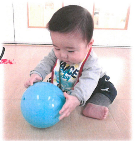
持ってみたり 角をみたり... それぞれの遊び方を 楽しみました!!