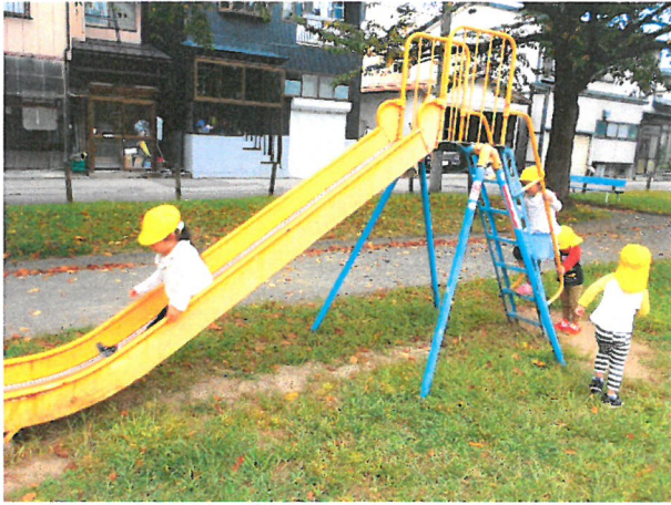
大型遊具は順番に貸し合、めいべぼうになてきました。