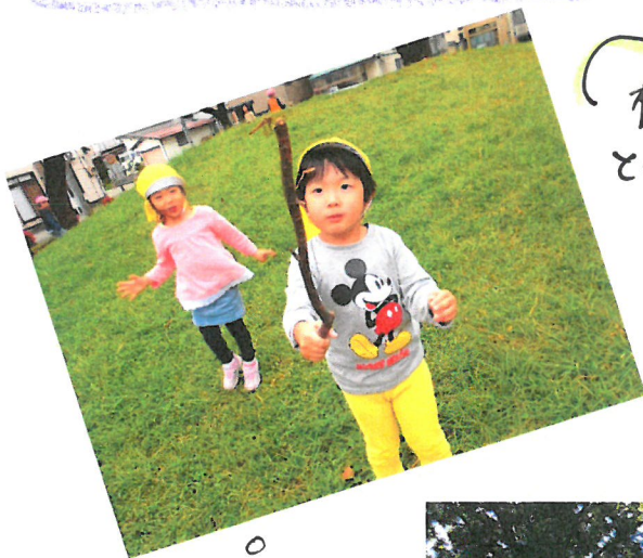
枝を使ての、とんぼとりが流行中です!!