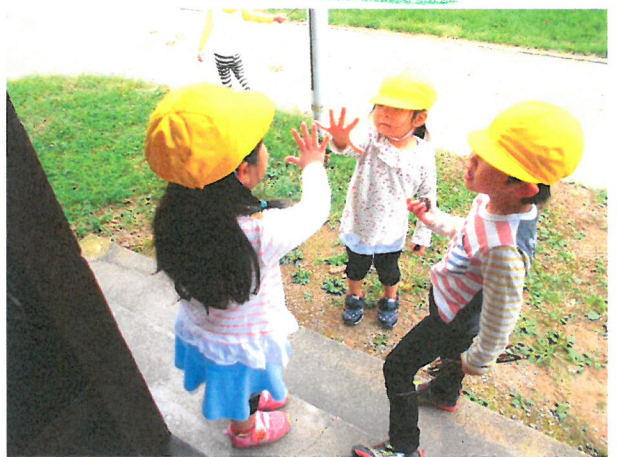
ジャンケンをして鬼ごっこするお友達もいました！(その後、すぐに鬼ごっこは終わっていました。笑)