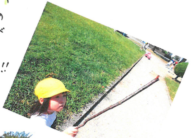
とんぼとり 名人がたーさん います。