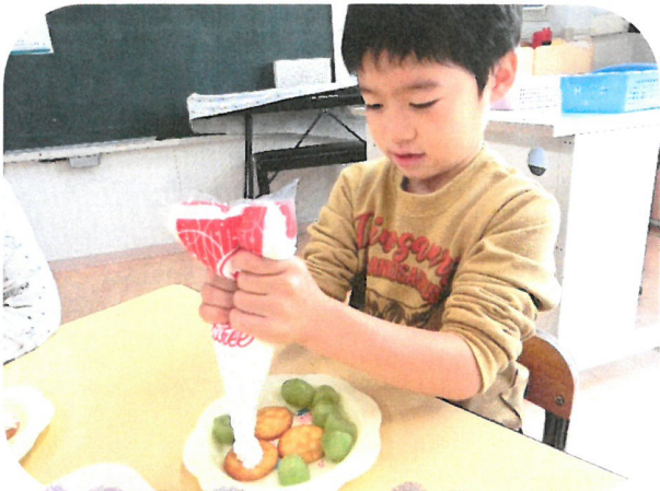
クリームしぼるのとっても上手~々 「たっくさんのせらっお~♡」

さくらくみの保護者の方からシャインマスカットを頂き、みんなごスイーツパーティーを しまいに☆とってもおもしろい!! 大きいマスカットにみんな大興奮でした♡♡