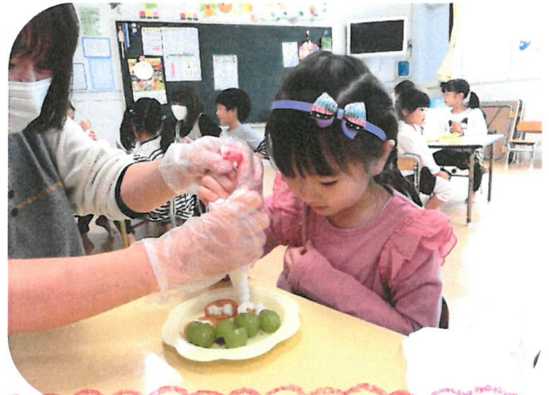
どんな風に飾りつけしようかな~? 「上手にできた!!」