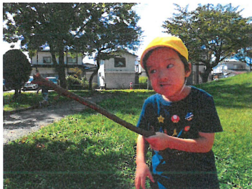
秋の自然に触れたり、体を存分に動かしながら、楽しませていただきます。