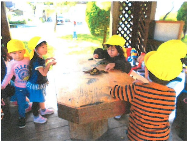
小石や葉っぱを集め、役柄を決め、ごっこ遊びも楽しんでます。