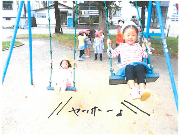
// サッポロ //