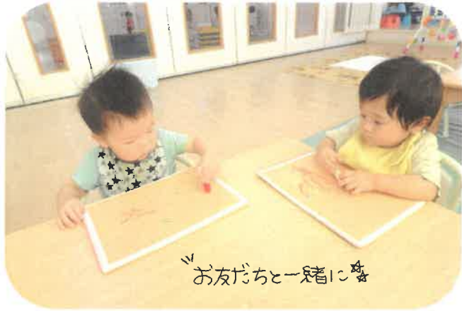
お友だちと一緒に

クレヨンを使ってお絵かき!! 前よりも力強く、おきりと描くことができていて成長を感じました