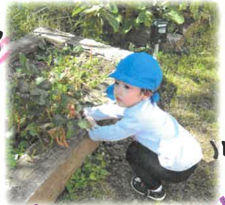
インゲンみつけた♡