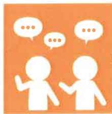
9. 言葉による伝え合い

「お店屋さんごっこしよう!」 「僕も入れて?」「いいよ!」 「お客さん呼ぶね」など、 みんなが役割を決めながら 遊んでいまして、言葉 が増え、お友達とのやりとり も楽しそうですよ