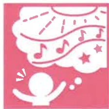
10. 豊かな感性と表現