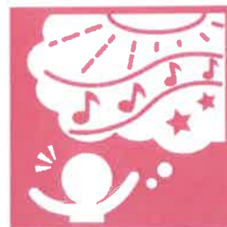
10.豊かな感性と表現