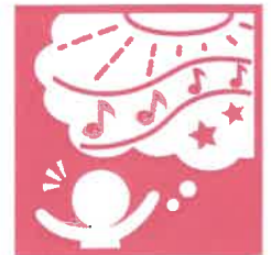
10. 豊かな感性と表現

苦戦しながらも、一生懸命取り組む「できたよ!!」と 見てくれる姿に成長を感じています!!