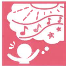
10. 豊かな感性と表現

頭の中のイメージを好きな色を使って 思い思いに表現しています。 表現を楽しむ姿にきらり、