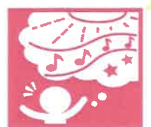
10. 豊かな感性と表現