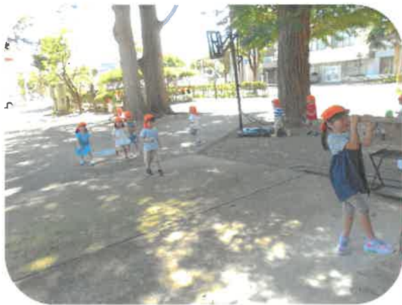
だるまさんがころんだ!!