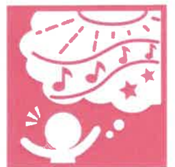
10. 豊かな感性と表現