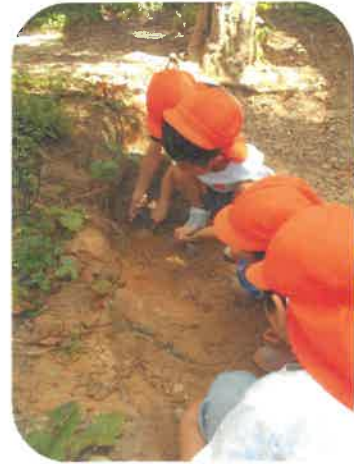
みんながやる 突振中... どんな虫 が出てきた かな? 🐛