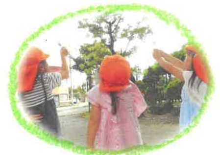
葉っぱを透かしてみると綺麗だね〜