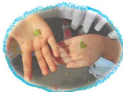
ハート型なのも可愛い!! ♡