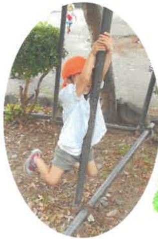
ウキウキお猿さんだよ☆