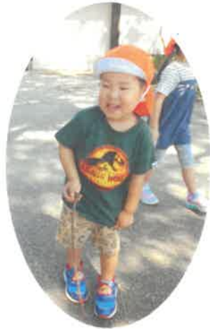
杖や、くつな木の棒 見つけたよ!!

暑い日が続き、沢山本堂前に遊びに行っています！本堂前に行くことを伝えると、いつも大喜びなももくみです😊