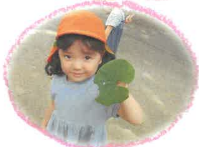
トトロの葉っぱ見つけたよ!

葉っぱの絵本を読んだから、「同じ葉っぱを見つけた」と見せに 来ってくれるようになりました😊 これからもみんなと一緒に 発見をし、喜んでいきたいです♡