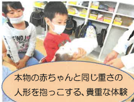
本物の赤ちゃんと同じ重さの 人形を抱っこする、貴重な体験