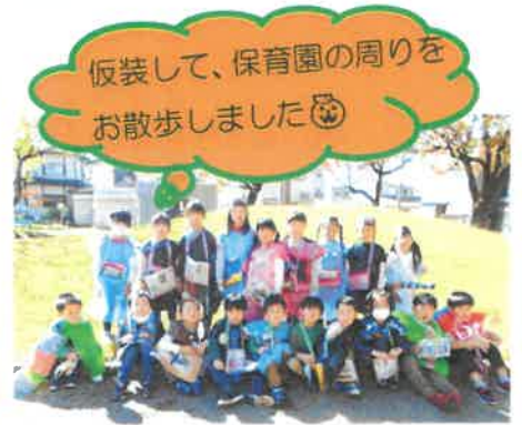
仮装して、保育園の周りをお散歩しました🍁