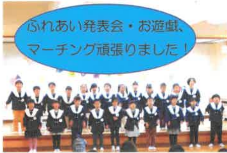
ふれあい発表会・お遊戯、 マーチング頑張りました！

今年も残すところ1か月となりました。「サンタさんってさ〜」「プレゼントもうきめたよ！」と子どもたちは今から楽しみにしています(*^-^*) ますます寒さが厳しくなりますね🌬️体調管理・感染対策をしっかりしていきたいと思います。