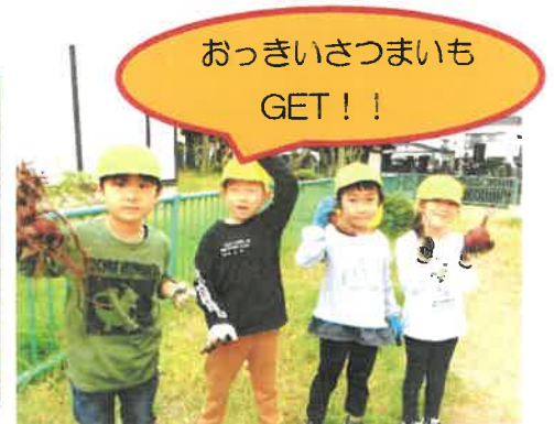
おっきいさつまいも GET！！