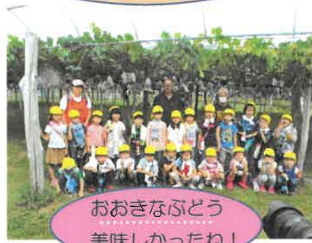
おおきなぶどう 美味しかったね！