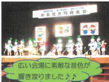
広い会場に素敵な音色が 響き渡りました♪♪