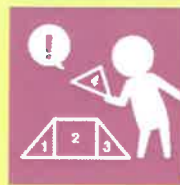
8. 数量・図形・文字等への関心・感受