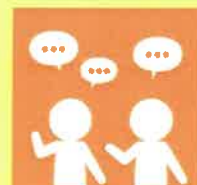
9. 言葉による伝え合い