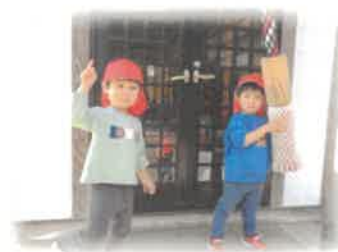
おはなをみつけたよ～