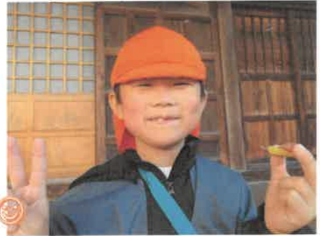
ホクホクの甘いお芋だったよ 😊