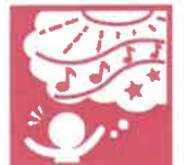
10. 豊かな感性と表現