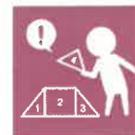
5. 自信・興味・探究心への関心・育成