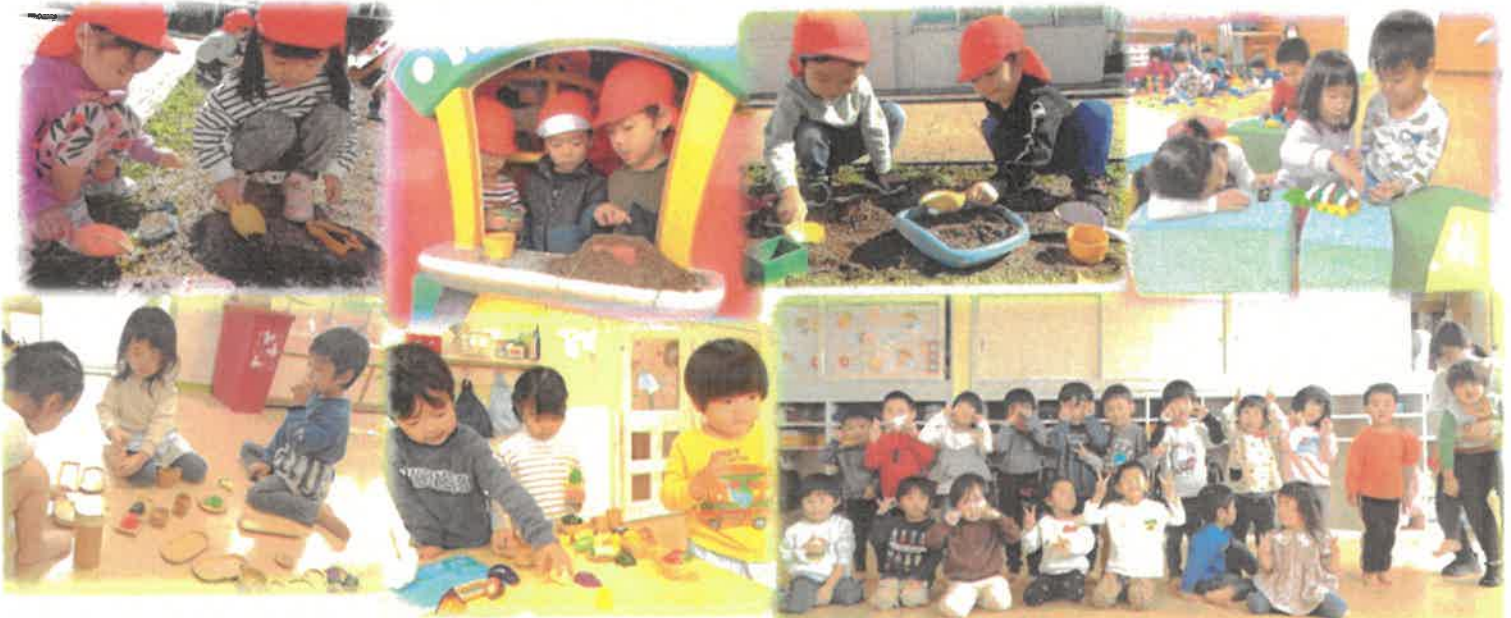
お遊戯の練習風景

天気の良い日は戸外に出かけて虫探しや砂遊び、遊具で遊びながら秋の雰囲気存分に楽しむことができました!!また、お遊戯会に向けてお遊戯やお歌の練習も頑張りました♪「お家の人が見に来てくれる~!!」とワクワクしながら練習に取り組んでいました😊当日は緊張すると思いますが、たくさんのお家の方々に見守ってもらいながら伸び伸びと活動できるといいなと思っています😊❤️