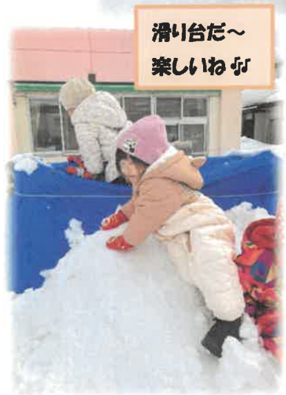
滑り台だ~ 楽しいね