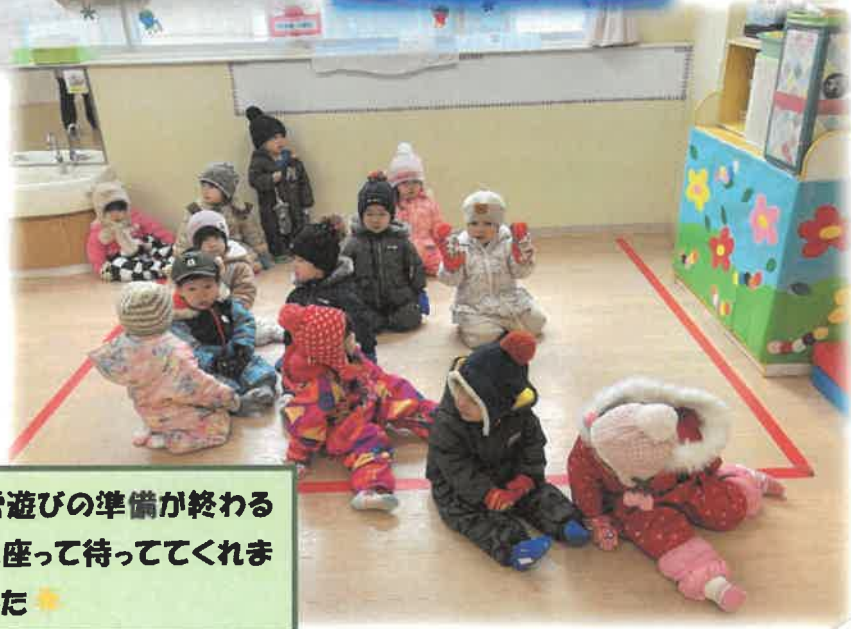
雪遊びの準備が終わると座って待っててくれました