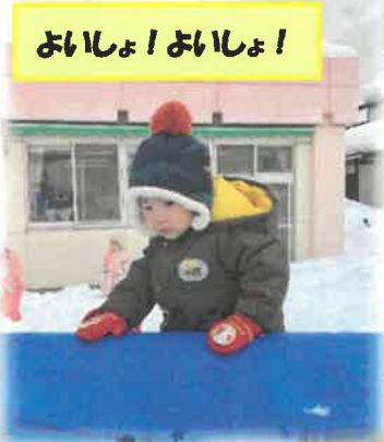
おいしょ!おいしょ!