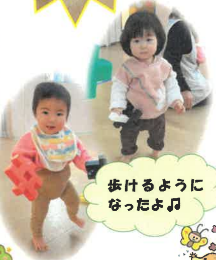
歩けるようになったよ♪