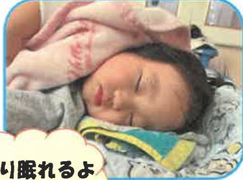
ぐっすり眠れるようになったよ😊