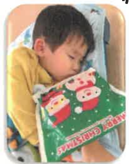
サンタさんからのプレゼント 🍎

この一年、保護者の方々と可愛い子どもたちの成長を見守ることができ嬉しかったです 🍁 また、保育へのご理解、ご協力をいただき本当にありがとうございました！来年度に向け、少しずつ準備をしながら、残りの日々も思いっきり楽しみたいと思います( ^_^ )