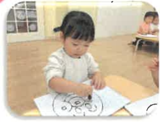
楽しいね！ アパマンの絵え