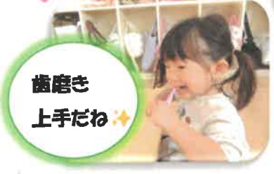
歯磨き 上手だね ✨