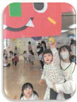
おには〜そと！ ふくは〜うち！