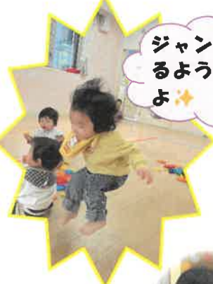
ジャンプができるようになったよ😊