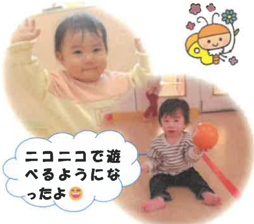
ニコニコで遊べるようになったよ😊