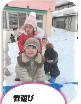
雪遊び 楽しかったね 🍎