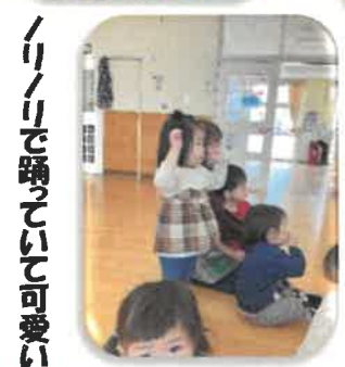
ノリノリで跳ごいて可愛い 🍎