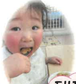
モリモリご飯が食べられるようになったよ😊